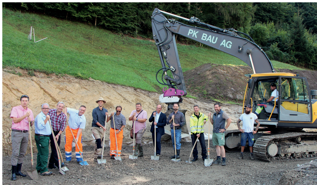
Spatenstich, September 2018

Das Einzugsgebiet des Wärmeverbundes erstreckt sich aktuell vom Werkhof Foribach südlich über die Enderierstrasse zur Flüelistrasse und von der Militärstrasse bis zum Kantonsspital, wo das bestehende Netz, welches über die Brünigstrasse bis zum Gemeindehaus Sarnen führt, integriert wird (siehe Situationsplan). Der Leitungsbau im Siedlungsgebiet ist mit einem straffen Zeitplan belegt, um die Dauer der Einschränkungen möglichst kurz zu halten. Die Bauherrschaft dankt den betroffenen Anwohnern für das Verständnis für die Umtriebe während der Bauphase.