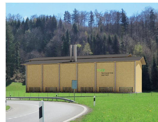
Visualisierung Heizwerk Foribach

Nähere Auskunft über den Bauplan und die Anschlussmöglichkeiten für Private erhalten Interessierte bei der Holz-Fernwärme Sarnen AG, Freiteilmattlistrasse 50, 6060 Sarnen oder bei der Korporation Freiteil, E-Mail info@freiteil.ch oder Tel. 041 660 33 44.